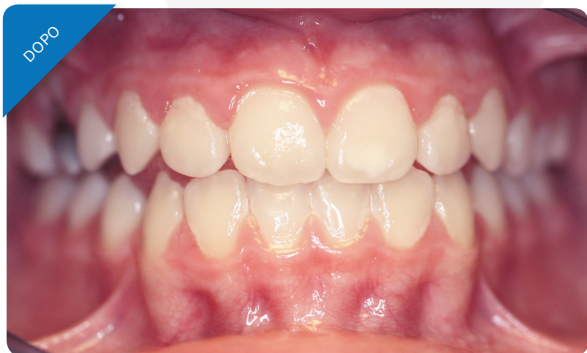
Quattro mesi dopo l'applicazione.